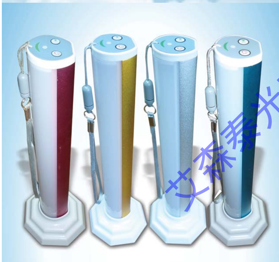
充电应急灯配置一览表